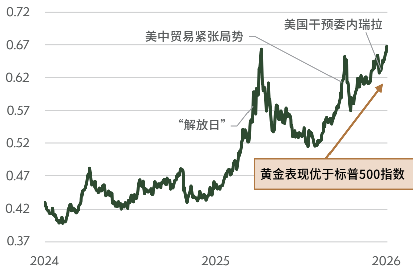
黄金(美元,盎司)/标普500指数